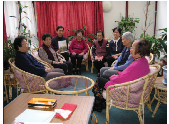
प्रोजेक्ट को-आर्डिनेटर फोकस गरुप वार्तालाप में भाग लेते हुए ।